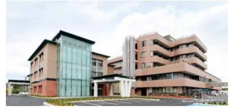
社会福祉法人 太陽会 安房地域医療センター Awa Regional Medical Center

当院は365日24時間体制で、千葉県南房総地域の2次救急医療を担う役割を果たしております。亀田総合病院(3次救急)の全面的協力のもと、急性期医療から術後のリハビリテーションや退院支援まで、地域の皆さまが安心して受診していただける地域密着型の病院です。OJTを含めた各種新人教育や継続教育によって個人の能力を最大限に生かします。